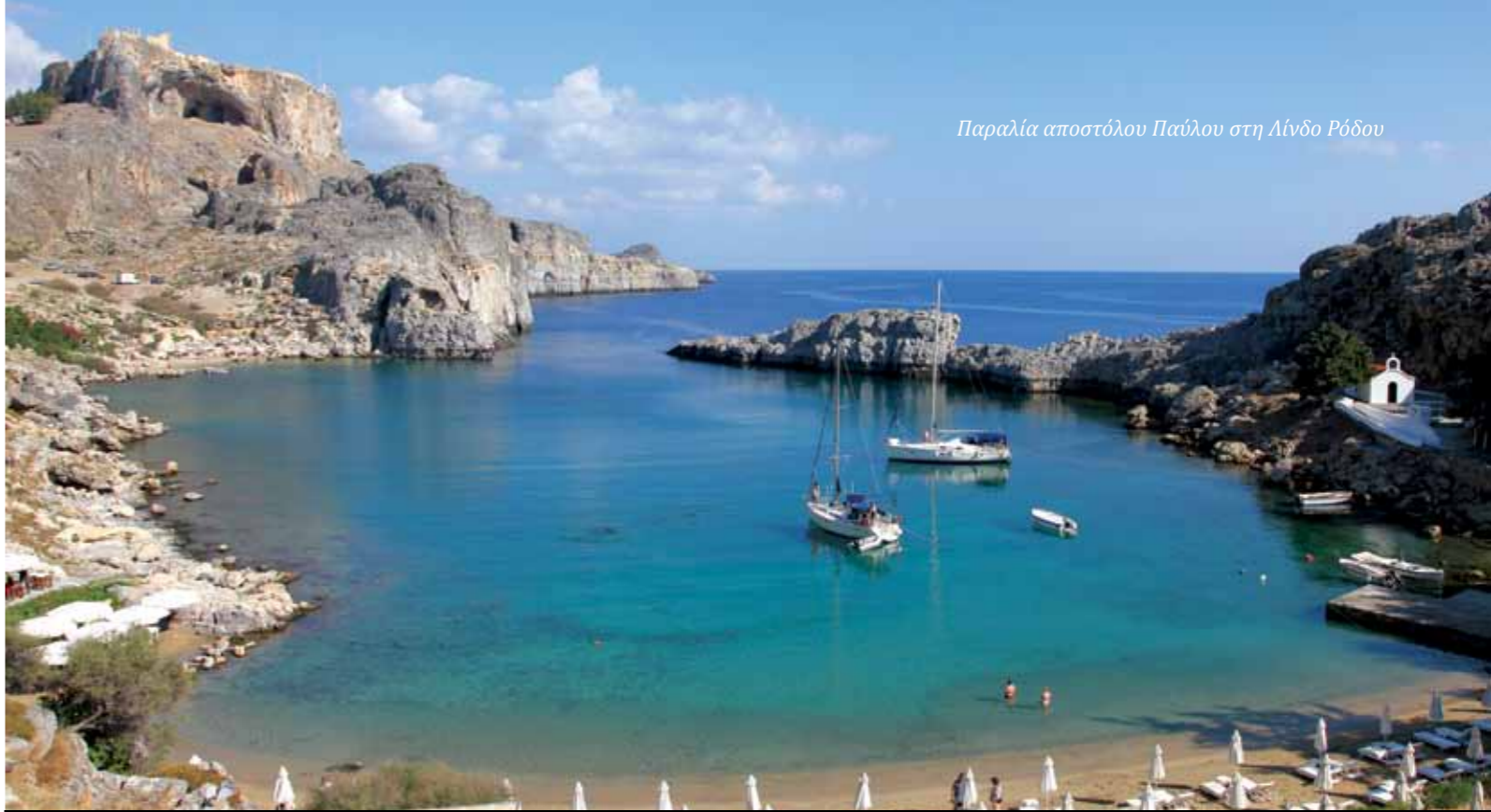
Παραλία αποστόλου Παύλου στη Λίνδο Ρόδου

Τέλος, ένα ιδιαίτερα σημαντικό εύρημα στον αρχαιολογικό χώρο της Κορίνθου είναι μια λατινική επιγραφή που εντοπίστηκε στη μικρή πλατεία ανατολικά του θεάτρου και χρονολογείται στο α΄ μισό του 1ου αιώνα μ.Χ. Η επιγραφή αυτή τοποθετήθηκε εκεί προς τιμήν κάποιου Έραστου, οικονόμου της πόλης της Κορίνθου, ο οποίος χρηματοδότησε την πλακόστρωση της πλατείας ως ανταπόδοση για την τοποθέτησή του στη θέση αυτή. Η σημασία του ευρήματος αυτού έγκειται στο γεγονός ότι πρόκειται προφανώς για τον ίδιο Έραστο που μνημονεύεται στην προς Ρωμαίους επιστολή (16,23) ως οικονόμος της πόλης της Κορίνθου, πιθανώς δε και για τον Έραστο που αναφέρεται και αλλού στην Καινή Διαθήκη (Πράξ. 19,22 και Β΄ Τιμ. 4,20) δεδομένης της σπανιότητας του ονόματος και της συσχέτισής του και πάλι με τον Παύλο και την πόλη της Κορίνθου. Αντίστοιχης σημασίας εύρημα, αν και όχι από τον αρχαιολογικό χώρο της Κορίνθου, αλλά των Δελφών, είναι και η λεγόμενη επιγραφή του Γαλλίωνος , η οποία αποτελεί την αρχαιολογική τεκμηρίωση της αναφοράς του Παύλου στον ομώνυμο ρωμαίο ανθύπατο, κατά την πρώτη επίσκεψή του στην Κόρινθο.