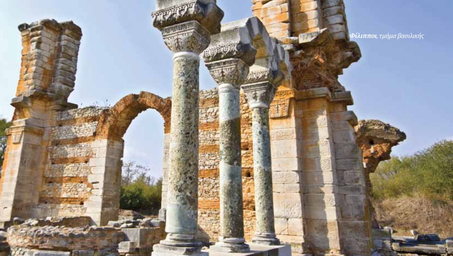
Φίλιπποι, τμήμα βασιλικής