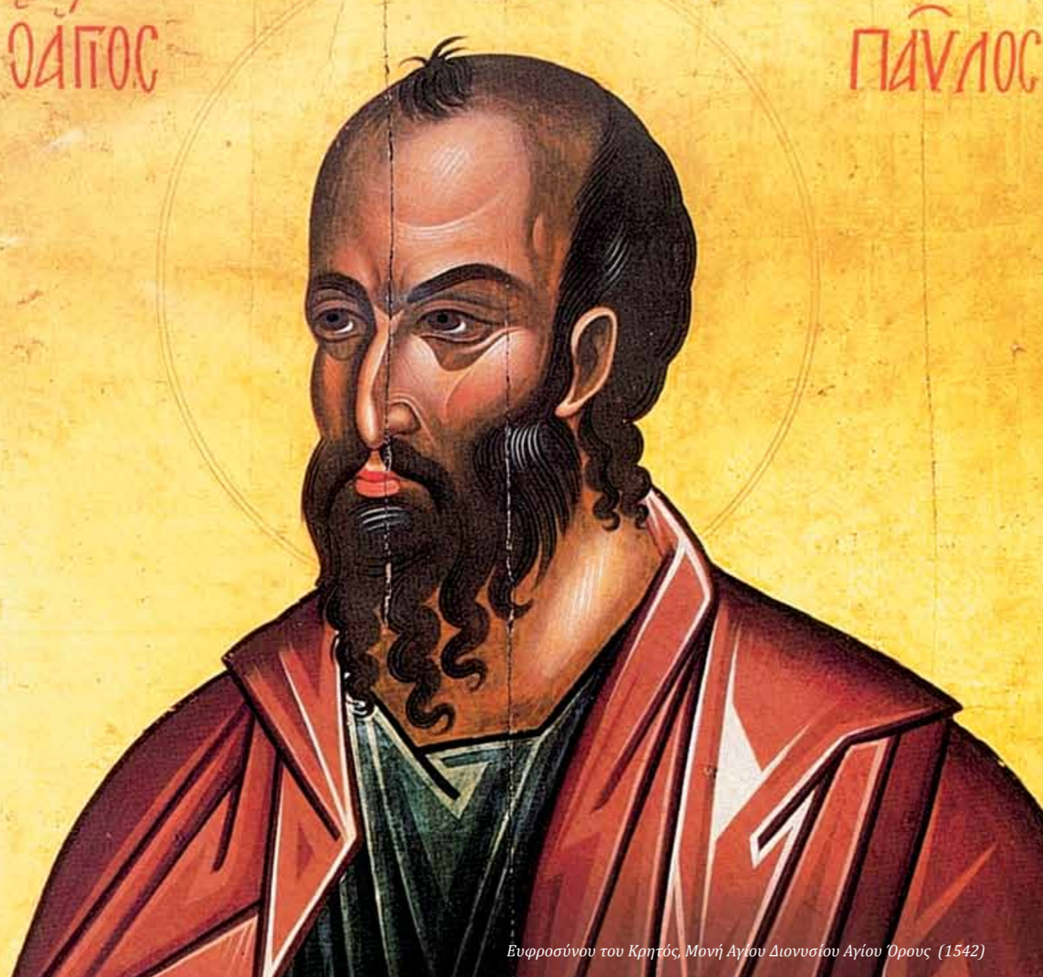
Ευφροσύνου του Κρητός, Μονή Αγίου Διονυσίου Αγίου Όρους (1542)