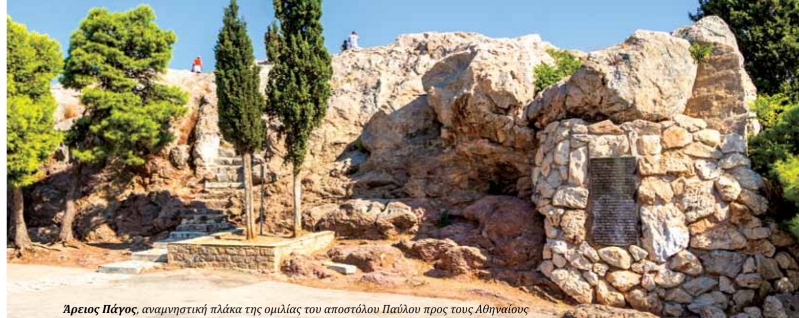
Άρειος Πάγος, αναμνηστική πλάκα της ομιλίας του αποστόλου Παύλου προς τους Αθηναίους