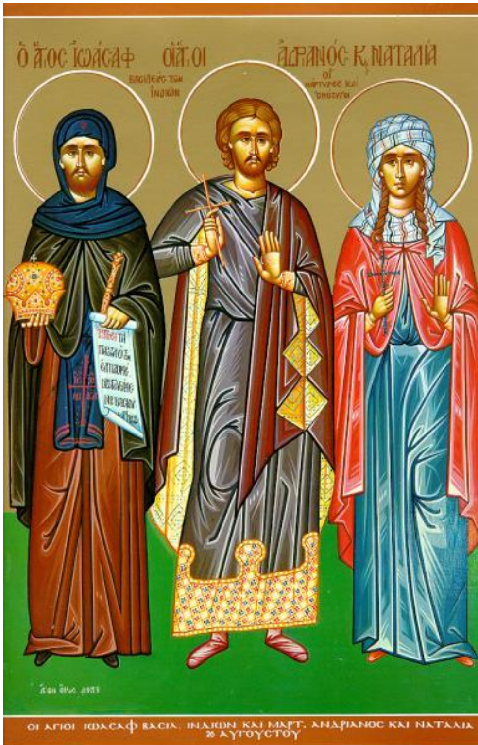
Εικ. 5 Ἅγιοι Αδριανός και Ναταλία και Ἅγιος Ἰωάσαφ