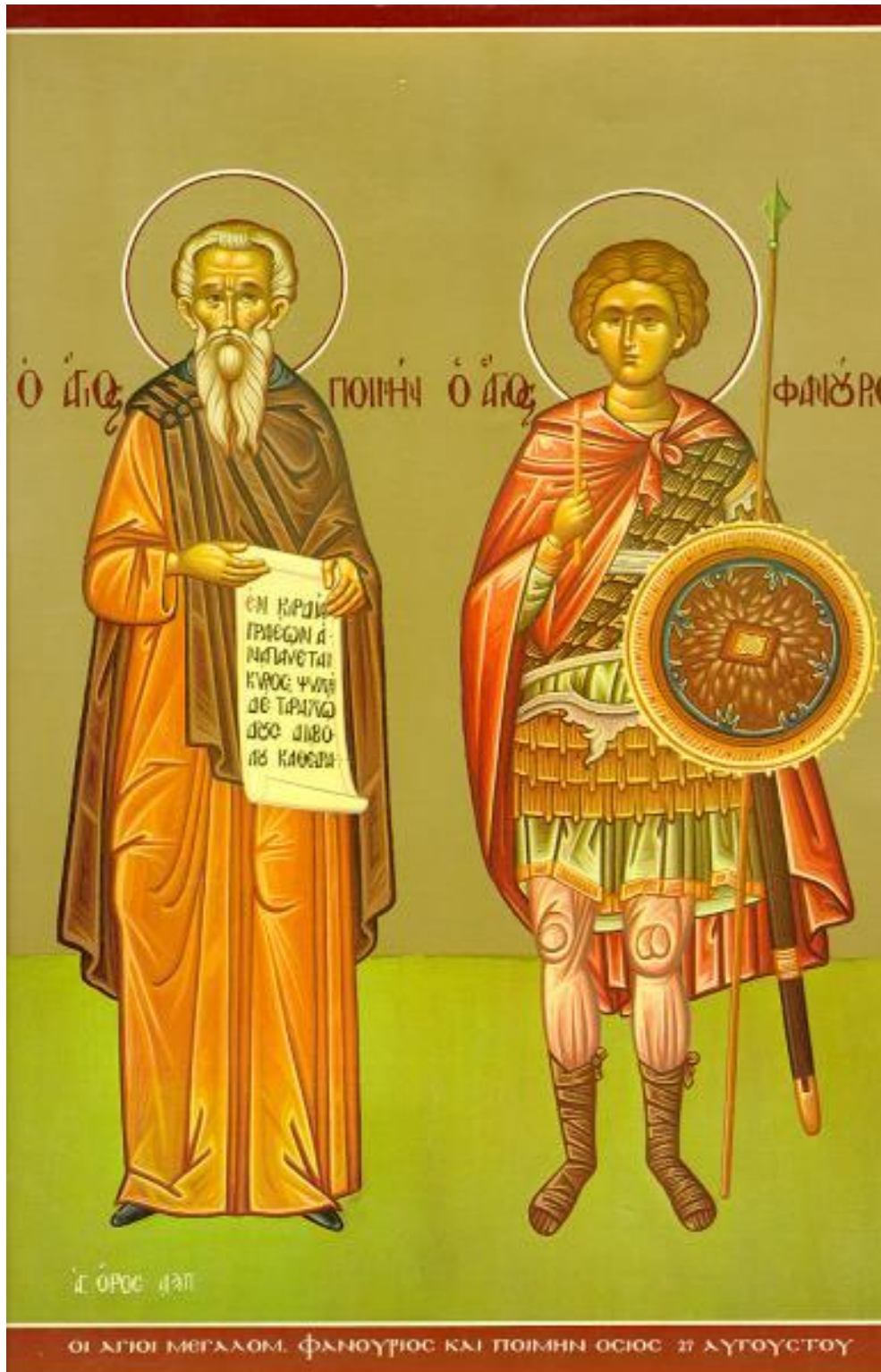
Εικ. 6 Ὁσιος Ποιμὴν καὶ Ἅγιος Φανούριος