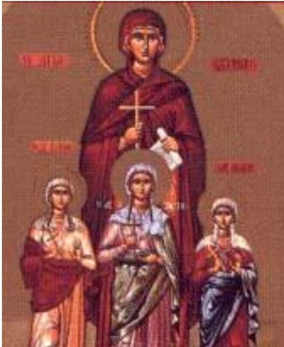
Εικ. 9 Αγίες Σοφία, Πίστη, Αγάπη και Ελπίδα