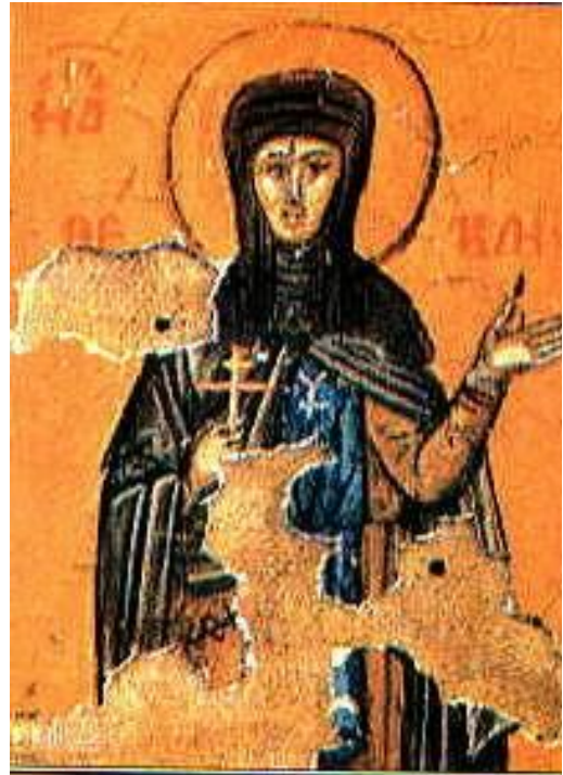
Εικ. 10 Αγία Θέκλα