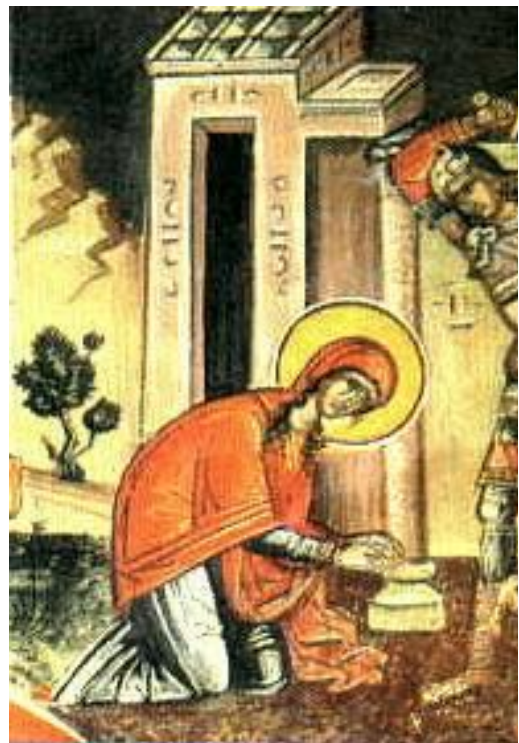
Εικ. 4 Μαρτύριο Αγίας Χριστίνας