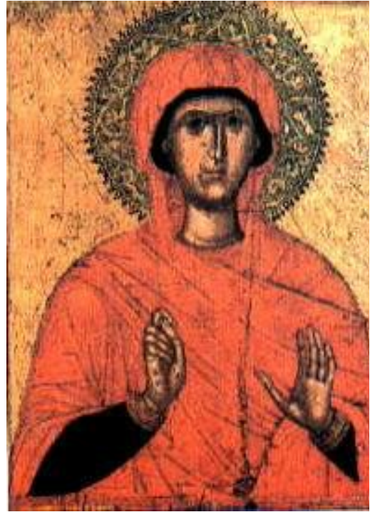
Εικ.2 Αγία Μαρίνα