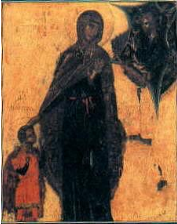
Εικ.1 Αγία Ιουλίττα και Άγιος Κήρυκος