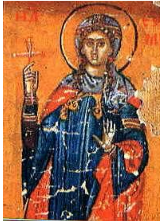
Εικ. 8 Αγία Ευφημία