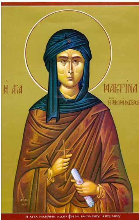
Εικ.3 Οσία Μακρίνα