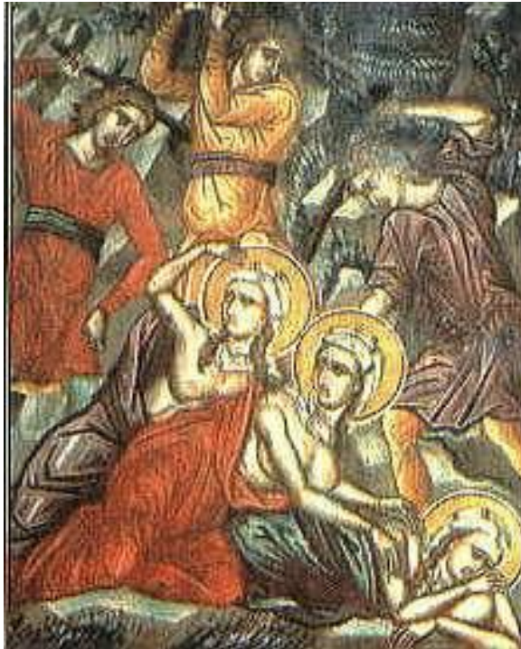
Εικ. 7 Μαρτύριο των Αγίων Μηνοδώρας, Μητροδώρας και Νυφοδώρας