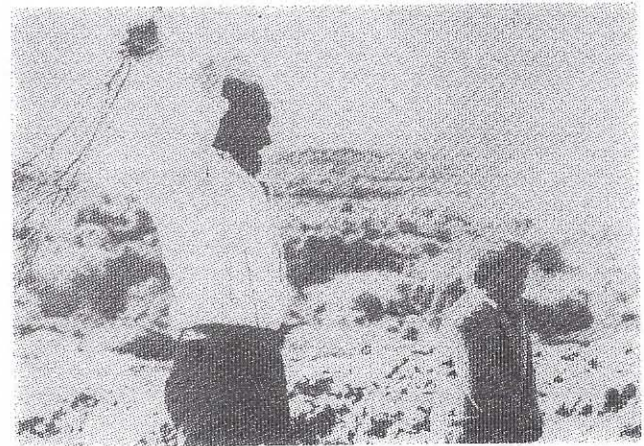
Ἀπὸ ἓναν «Πατέρα ἀφέντη»...

Δὲν εἶναι πάντοτε εὐκόλο νὰ συγκεντρωθῶμε, νὰ στοχαστοῦμε καὶ νὰ μνημονεύσουμε τὴ μορφή τοῦ πατέρα.