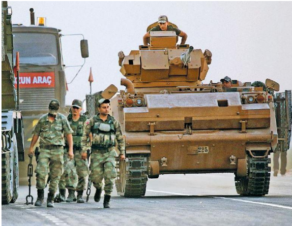
Εισβολή των Τούρκων στη Βόρεια Συρία. «Η Καθημερινή» 13.10.2019, σ. 1.

Υπάρχουν πάντα οι πρόθυμοι να παραλάβουν την σκυτάλη...