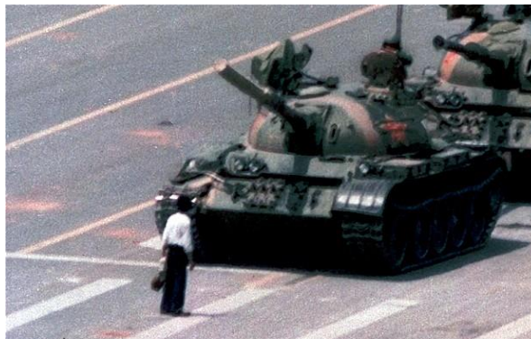
Πλατεία Τιέν Αν Μεν, Ιούνιος 1989 2 .