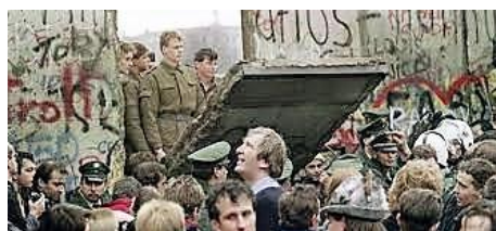
Η πτώση του Τείχους του Βερολίνου (9 Νοεμβρίου 1989).