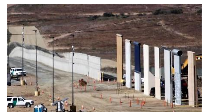
Το «Τείχος» του Τράμπ (στα σύνορα με το Μεξικό).

Αλέξανδρος Μ. Σταυρόπουλος (4 Νοεμβρίου 2019)