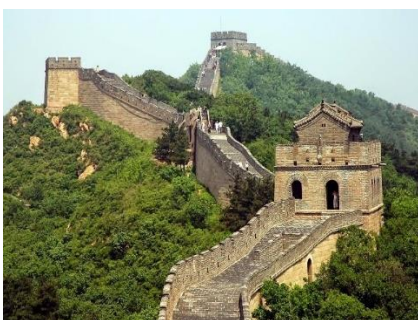
Σινικό Τείχος: μήκος 8.850 χλμ.

Κατά τα άλλα, εξακολουθούμε... όπως πάντα, να υψώνουμε ανάμεσά μας τείχη, τοίχους και φράκτες, έστω κι αν κάποια στιγμή γκρεμίζουμε και κάποιο τείχος !